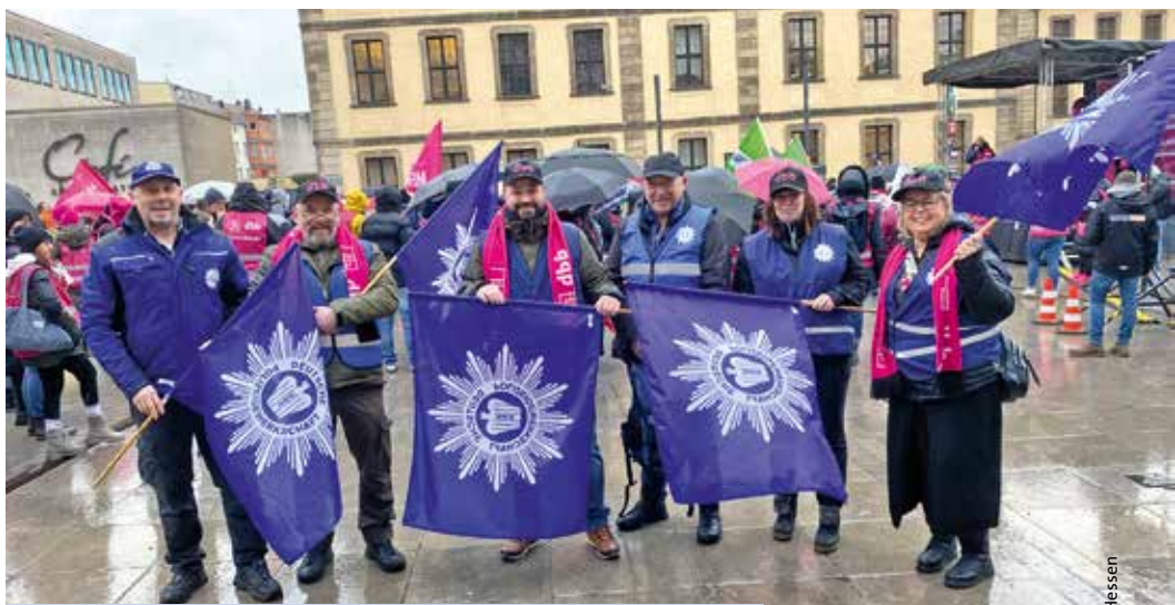
DPoIG-Abordnung bei der Abschlusskundgebung in Fulda

Weitere Arbeitsk Kampfmaßnahmen sind geplant und auch da wird die DPoIG wieder Flagge zeigen für das Wohl der Beschäftigten.