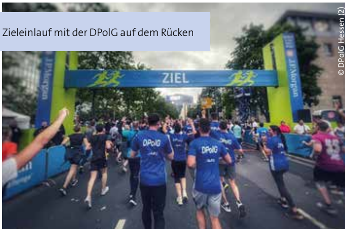
Zieleinlauf mit der DPoIG auf dem Rücken

In diesem Jahr nahm die 4. Dienstgruppe des 14. Polizeireviers Frankfurt am Main am J.P. Morgan Lauf unter dem Motto „DPoIG