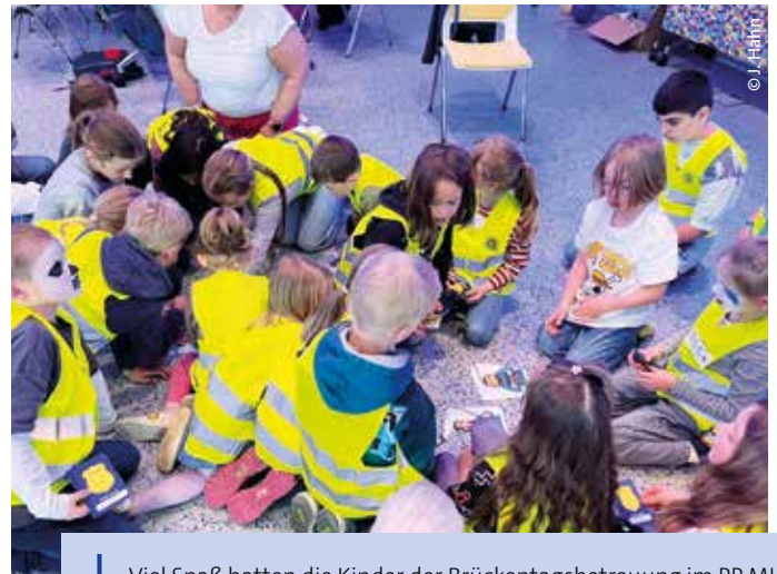
Viel Spaß hatten die Kinder der Brückentagsbetreuung im PP MH.

Am frühen Morgen wurden die 24 Kinder von ihren Eltern in den geschmückten Saal „Florenz“ gebracht und bekamen gleich zu Beginn von Pro Polizei eine Warnweste. Mit vielen Spielen, einer Kinderschminkerin, Spaß und leckerem Essen verging der Tag wie im Fluge.